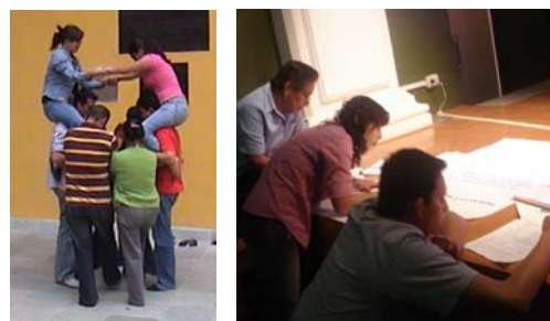
Actividades realizadas en el marco del Taller de Capacitación para promotores de Carta de la Tierra