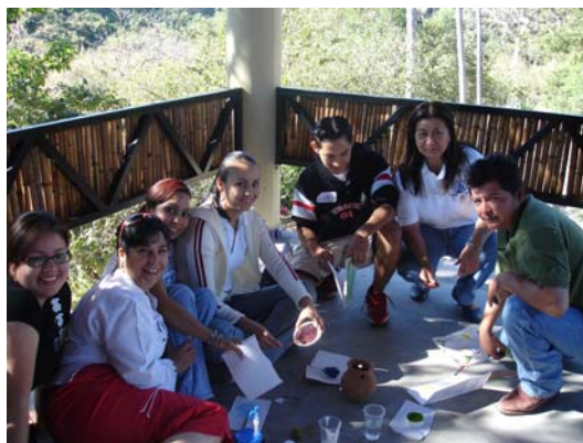
Dinámica del rompecabezas realizado por jóvenes participantes del Taller.

Taller de capacitación para promotores de Carta de la Tierra: Organizado por la Universidad de Guanajuato, realizado 10 y 11 de marzo de 2007.