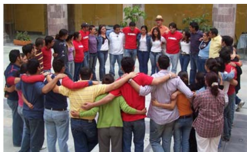
Jóvenes de diferentes Estados unidos por la Carta de la Tierra