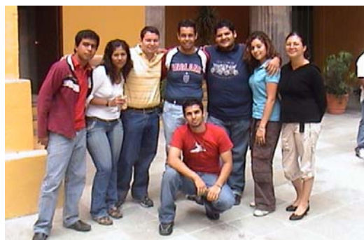
Grupo Juvenil de Promotores de Carta de la Tierra Colima que participaron en el Taller de Capacitación