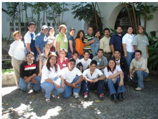
Algunos de los 43 participantes del Taller de Carta de la Tierra; De Jóvenes para Jóvenes.

Taller de Carta de la Tierra de Jóvenes para Jóvenes realizado en Colima, Col. El 9 y 10 de febrero de 2007.